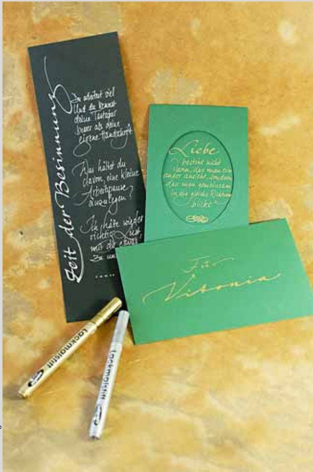
Ausarbeitung und Fotos: Gosbert Stark