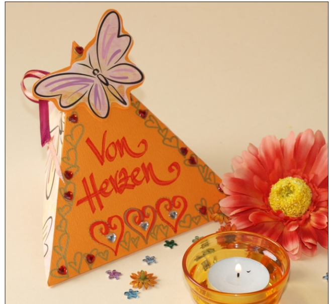
Variante 2: „Von Herzen“