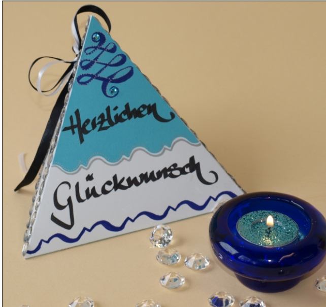
Variante 1: „Herzlichen Glückwunsch“