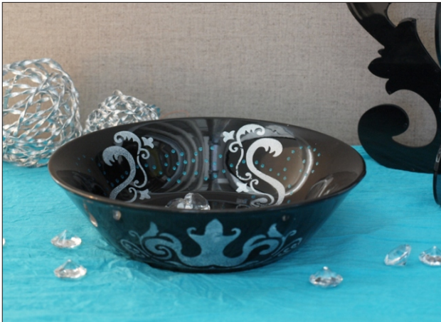
Variante 1: Schwarze Keramik - „Edles Weihnachten“ (EW)