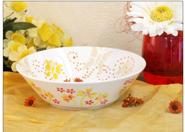
Variante 2: Weißes Porzellan - „Summertime“ (ST)